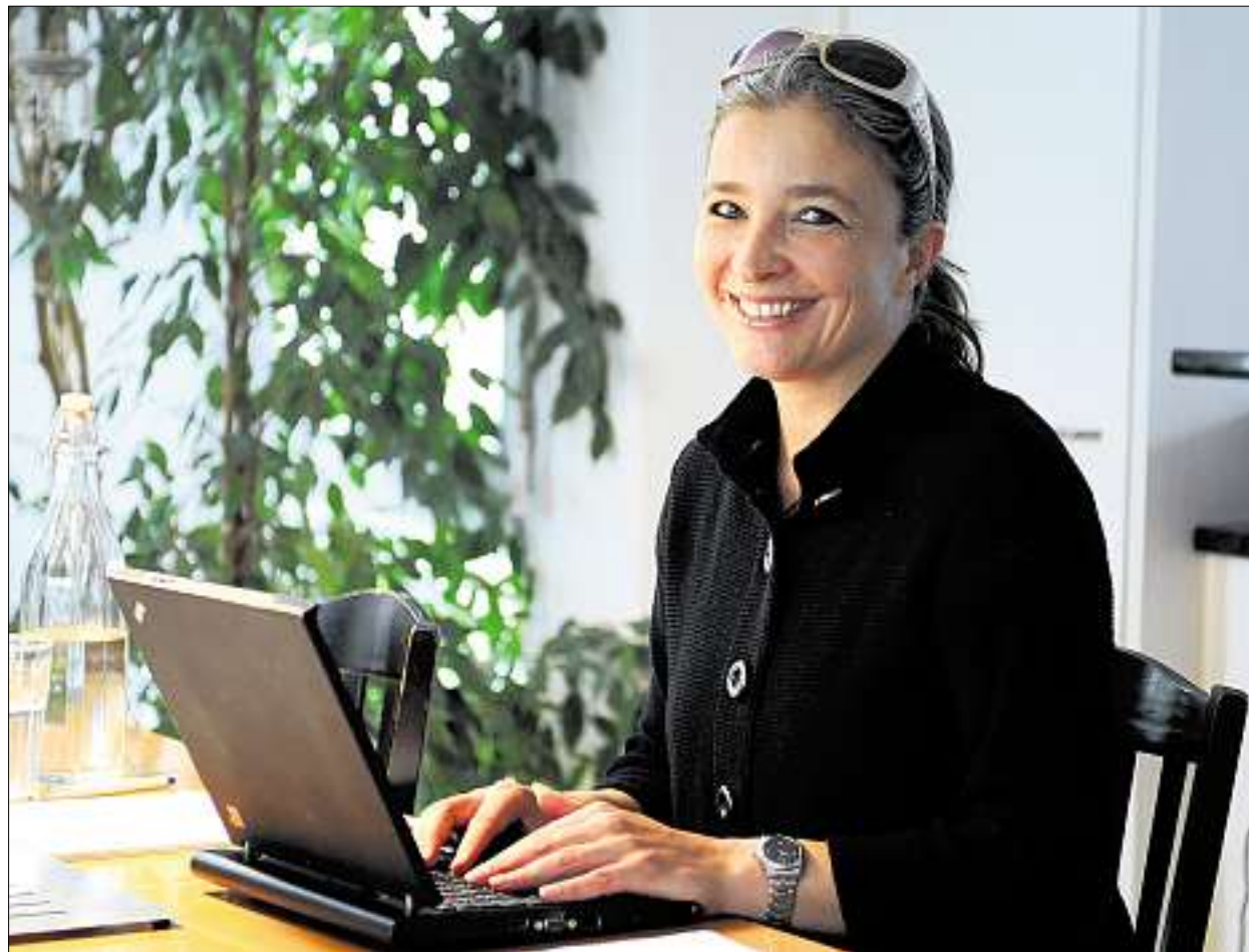
Will im Kampf gegen die Internetkriminalität vorwärtskommen: CVP-Nationalrätin Barbara Schmid-Federer. (Reto Schneider)

Erstens ist die Schwelle, den Computer zu benutzen, dadurch kleiner. Zweitens passiert es immer öfter, dass Kinder übers Netz von Pädophilen belästigt werden. Wenn ein Kind so etwas im eigenen Zimmer vor dem Einschlafen erlebt, ist das noch schädlicher als sonst. Steht der Computer in einem separaten Raum oder im Wohnzimmer, können die Eltern ab und zu einen Blick auf den Schirm werfen.